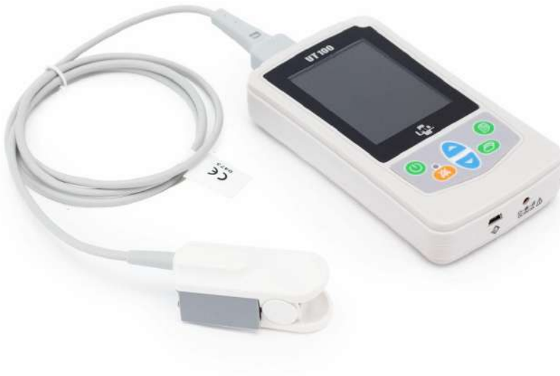
ME04605A - OXÍMETRO DE PULSO MD PORTÁTIL LCD COLORIDO BIVOLT UT1 Oxímetro de Pulso – Portátil – UT-100 – Macrosul