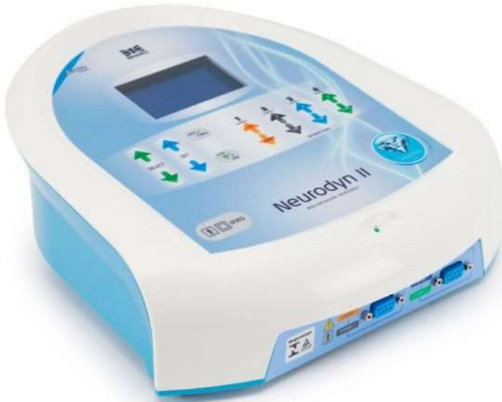
ME01715A - NEURODYN II N53, BIVOLT - IBRAMED Neurodyn II Ibramed – Aparelho de TENS, FES e Russa – 04 Canais