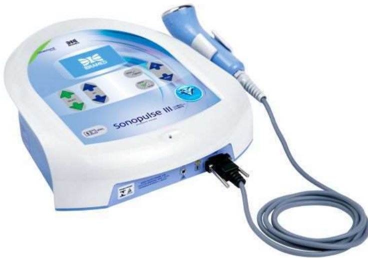
ME00000A - SONOPULSE III 1 E 3 MHZ S34, BIVOLT - IBRAMED Sonopulse III Ibramed - Aparelho de Ultrassom de 1 e 3 MHz