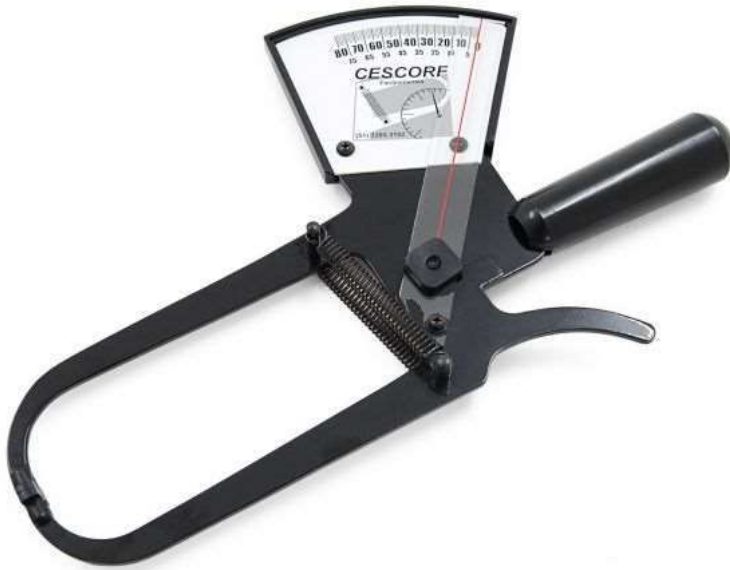
ME01263A - PLICOMETRO CLINICO COM MALETA DE TRANSPORTE - CESCORF Adipômetro Clínico - Cescorf